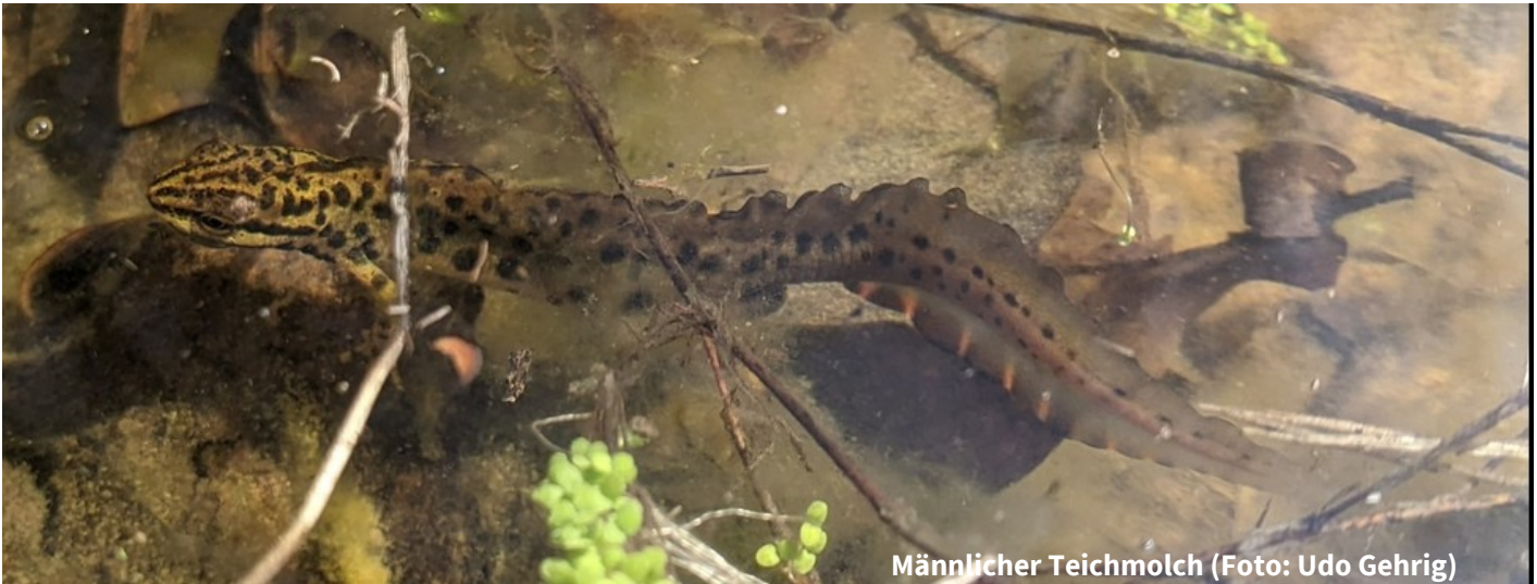
Männlicher Teichmolch

Butterbrezeln und Getränke wurden von Familie Salomon gestellt.