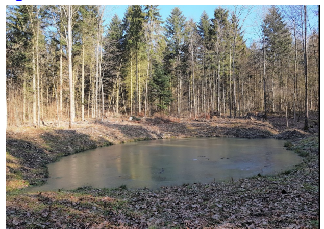
Waldteich im Gewann Schreckenbusch

Tel.: +49 (0)9343 58 99 940 Email: info@nabu-lauda.com Homepage: www.nabu-lauda.com