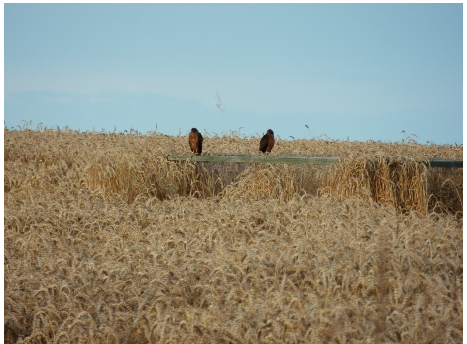
Wiesenweihe, Jungvögel