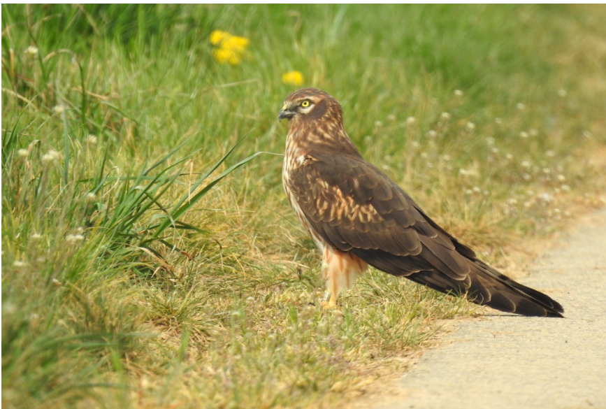
Wiesenweihe-Weibchen