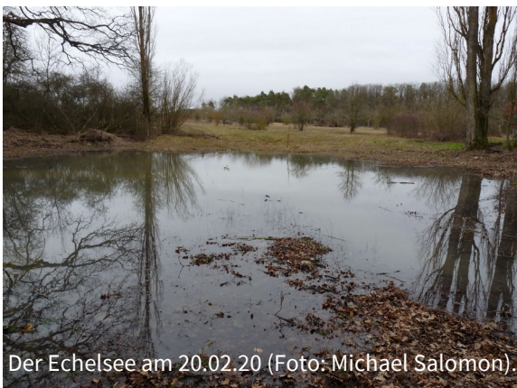
Der Echelsee am 20.02.20.

Aufgrund der stärkeren Regenfälle in den vergangenen Wochen ist unser Feuchtbiotop „Echelsee“ zwar nicht wirklich voll, aber immerhin doch so gut gefüllt, dass es als Laichgewässer für Erdkröte, Berg- und Teichmolch genutzt werden kann - inzwischen haben sich bereits die ersten Teichmolche eingefunden.